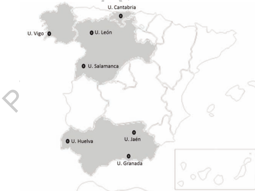
Figura 2 Distribución geográfica de las Universidades participantes en el Proyecto uniHcos

La recogida de información comenzó en diciembre de 2011, habiendo participado hasta ese momento un total de 1.363 individuos. Las encuestas se realizaron mediante cuestionario ad hoc online autocontestado, a través de la plataforma SphinxOnline®, que permite la creación de dos archivos