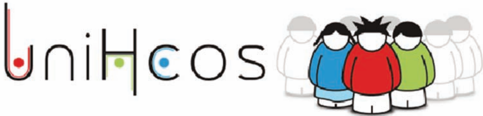
Figura 1 Logotipo del proyecto uniHcos

La invitación para participar en el estudio se envió a todos los alumnos que cumplieron los criterios de inclusión a los correos electrónicos institucionales, incluyendo una carta explicativa del estudio y sus objetivos, así como un consentimiento informado que debía ser cumplimentado por cada estudiantes para participar en el estudio, aclarando a su vez que los datos cedidos serán tratados de modo confidencial según dicta la Ley